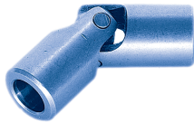
enkel / simple