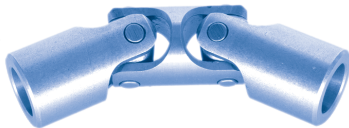
dubbel / double